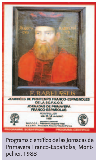
Programa científico de las Jornadas de Primavera Franco-Españolas, Montpellier. 1988