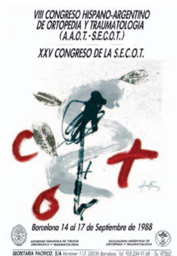
Programa científico del XXV Congreso Nacional. Barcelona 1988.