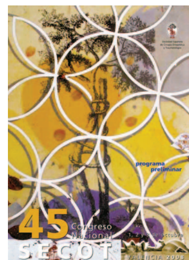
Programa científico del XLV Congreso Nacional SECOT. Valencia. 2008.

El Presidente resumió, a continuación, las gestiones realizadas por cada miembro de la Junta Directiva durante su mandato, aunque aquí referiremos solo lo relativo al periodo final, desde el Congreso de Madrid.