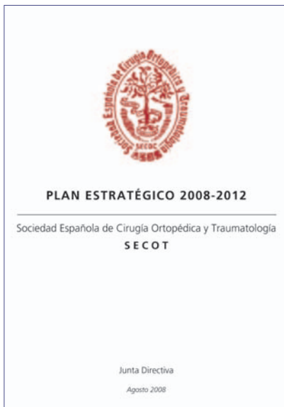
Portada del Plan Estratégico SECOT 2008-2012.

colaboración con la Escuela Andaluza de Salud. Se transfirieron a la Fundación 230.000 euros para el desarrollo de sus fines. Además, se firmó un nuevo convenio de colaboración con la Fundación Lavante por valor de 30.000 euros.